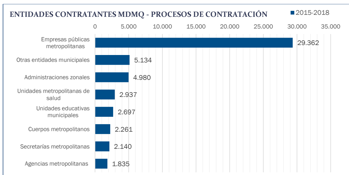
Gráfico No. 1. Entidades municipales y cantidad de procesos de contratación pública ejecutados entre los años 2015 y 2018.

La Dirección de Prevención y Control solicitó información, de todos los procesos de contratación que ejecutaron entre los años 2015 y 2018, a las 62 entidades y dependencias identificadas. Con la información recibida, se registró un total de 51.346 procesos de contratación —incluidos los procesos bajo la modalidad Ínfima Cuantía— que se distribuyen de la siguiente manera: