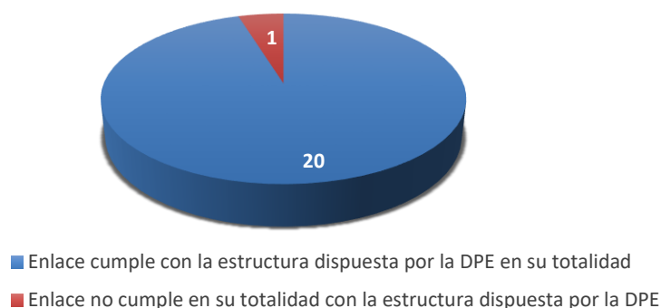
Gráfico No. 1. Cumplimiento de la estructura dispuesta por la DPE por parte de los sitios webs del Municipio de Quito